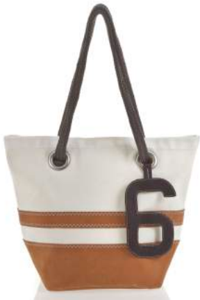
Sac Légende Striped Disponible en Dacron ® base acrylique Prix : 159 euros