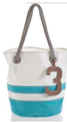
Sac Diego Striped Disponible en Dacron® base acrylique Prix : 169 euros