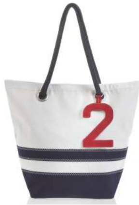
Sac Sam Striped Disponible en Dacron ® base acrylique Prix : 179 euros

Accessoires de sac en cuir. Design : Roger/ Beyou créateurs Prix : 35 euros